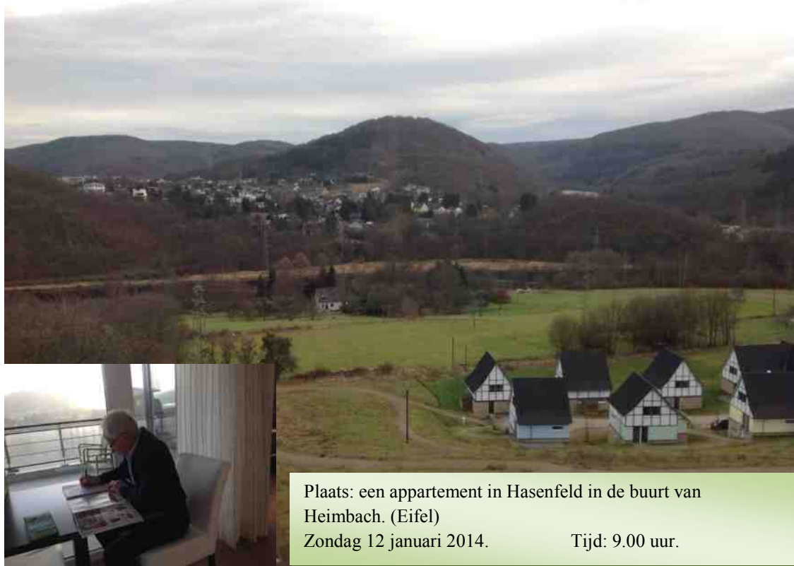
Plaats: een appartement in Hasenfeld in de buurt van Heimbach. (Eifel) Zondag 12 januari 2014. Tijd: 9.00 uur.

tussen de heuvelruggen de aandachttrekkers. Onder de blauwe lucht, voorzien van vliegtuigstrepen trekken mistflarden de heuveltoppen over en bij dit alles vraag ik me af: