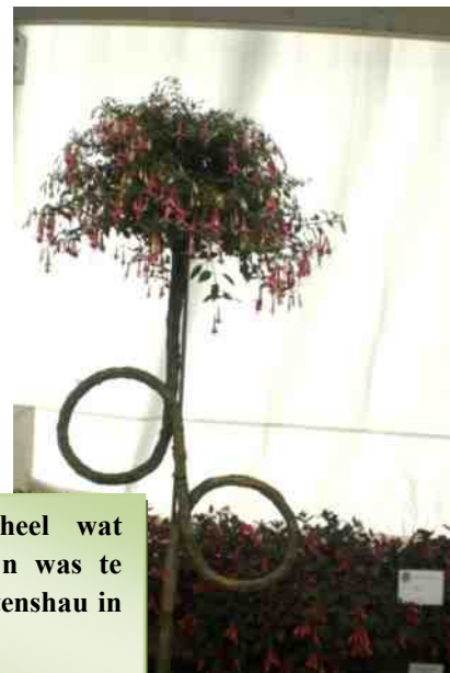
Dat met fuchsia's heel wat vormen te maken zijn was te zien op de Bundesgartenschau in Koblenz. (2011)

December: De verschillende ruimtes controleren en oppassen voor vergeten!