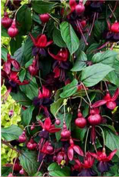
Lady in Black

Zowel de hangfuchsia's als de stamfuchsia's heb ik in februari uit hun slaap wakker gemaakt. Nou ja, wakker gemaakt. De winter 2013-2014 gaat de boeken in als een van de zachtste winters. Geen echte winter dus, want in