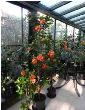
Overwintering van Hibiscus in de tuinkamer.

In mei zijn ze weer volop te koop, de mooie gedrongen planten van de Chinese roos. De remstoffen hebben hun werk gedaan en de bloemen zitten al aan de struiken of kroonbomen. Het aanbod is groot en het sortiment wordt steeds kleurrijker, maar de gekochte planten staan thuis wat de groei en de bloei betreft stil. Erger nog, de planten laten vaak hun knoppen vallen. Debet daaraan kan een gebrek aan licht zijn of een te droge lucht of.....moet de en de planten eerst wennen om de remstoffen uit hun "lijf" te krijgen. Lukt het de liefhebber de planten aan de groei te krijgen, dan is dat te zien aan de nieuwe, gerekttere scheuten. Deze nieuwe scheuten zullen na tien tot twaalf weken weer nieuwe bloemen dragen en worden de scheuten te lang, dan kan men ze zelfs toppen. Deze toppen kan men stekken, maar ze