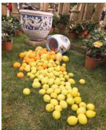
Zo'n oogst zullen wij niet hebben.

Juli: De fuchsia's naderen nu hun hoofdbloeiperiode. In deze maand is het een kwestie van verzorgen. De