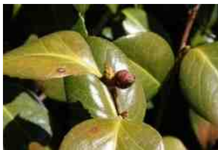
Schade aan de Camelliabladeren door strenge vorst.

Zo werd sinds de winter van 2008-2009 het aantal Camellia's in kuip van 49 stuks teruggebracht tot 9. In de winters daarvoor heb ik nooit dode planten ten gevolge van de vrieskou gehad. Na de laatste strenge winter heb ik geprobeerd een en ander op