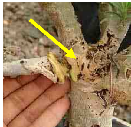
Daar waar de hoofdstam zich splitst is rot ontstaan. Wanneer men dat op tijd ontdekt kan men de plant nog redden. Men snijdt het rotte gedeelte weg tot in het gezonde stuk en hoopt dat de natuur de zaak herstelt.

De planten stonden in de zomer van 2013 evenals