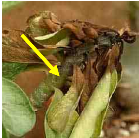
Tengevolge van de kou ( en te veel water) is stengelrot ontstaan.

2013 is een jaar van uitersten wat het weer betreft. Al vroeg op het eind van de zomer en het begin