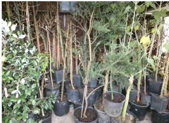
Al weer een jaar voorbij. De planten gaan in rust.

Oktober: Zeker na half oktober wordt de kans op vorst groter. De weersvoorspellingen bepalen wanneer de planten naar hun winterkwartier moeten. Er is een duidelijk verschil tussen de verschillende planten en dat heeft alles te maken met hun herkomstgebieden. Sommige kuipplanten moeten al naar binnen wanneer de