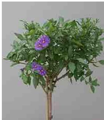
Door regelmatig te toppen ontwikkelt zich een compacte kroon.

Aan het einde van de winter en zeker in maart/april vormen vele kuipplanten in hun winterkwartier volop nieuwe scheuten. Na de lange winterse periode op een meestal te warme en te donkere plek in huis hebben ze vaak slappe, bleke scheuten met weinig blad. Deze bleke scheuten zullen beslist niet gaan bijdragen aan de vorming van een mooie struik of kroon en daarom moeten ze flink teruggesnoeid worden, zelfs tot een halve centimeter van de zijtak. De meeste kuipplanten kunnen deze terugsnoei goed verdragen en soorten als fuchsia, Chinese roos, Solanum, Abutilon, Lantana lopen aan de takken opnieuw uit.