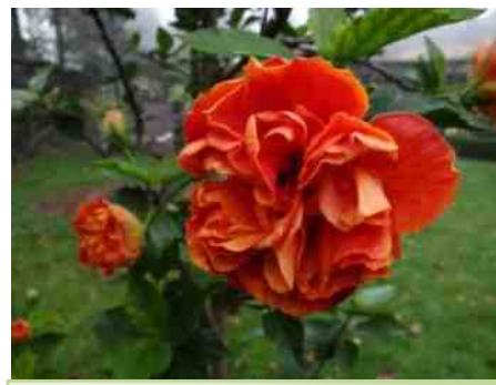
Een Hibiscus met gevulde bloemen.

Vanaf mei kunnen Chinese rozen ook in de tuin gezet worden. Dat kan op twee manieren. Met of zonder pot. In dat laatste geval betekent dat in de volle grond en men zal versted staan hoe goed die planten het in de zomer doen. Nadeel is weer