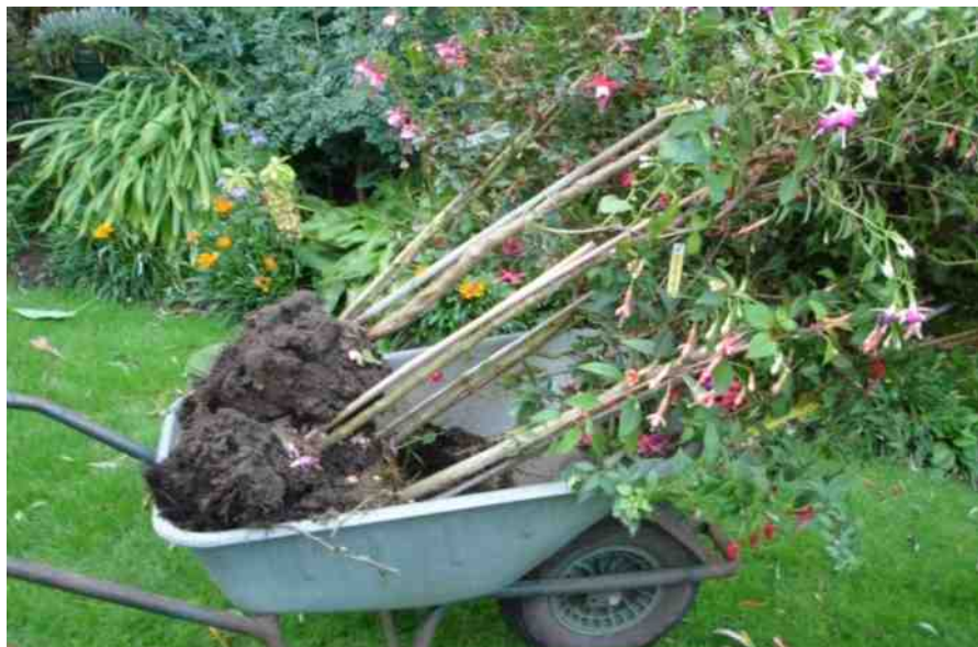
Naar de winterberging. Alweer een seizoen voorbij.

Zittend voor het raam, naar buiten kijkend over Hasenfeld, de witte huizen in de zon zien schitteren en de eenden op de Rur zien zwemmen, denk ik dat dit een heerlijk leventje zou zijn. Luieren, niets doen, de tijd aan jezelf hebben. Het leven niet meer bepaald laten worden door de loop der seizoenen. "Maar....." vraag ik me tegelijkertijd af. "Zou ik dat kunnen? Hoe zou ik de tijd invullen? Ik ben geen lezer, geen muziekluisteraar, geen avonturier. Hoe snel zou de verveling toeslaan?" Ja, voor een weekje in de Eifel kan dat. Dan schrijf ik en