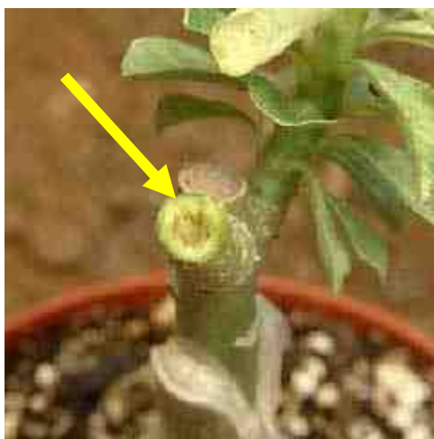
De stengel is tot in het gezonde gedeelte ingekort en hopelijk zal wondweefsel de wond dichtmaken.

De woestijnrozen hebben gedurende de groei- en bloeiperiode regelmatig water gekregen, al zou men verwachten dat de planten, die behoren tot de succulenten, een droge wortelkluit prefereren. Niets is in dit geval minder waar. Gedurende de groei- en bloeiperiode moeten ze regelmatig water en voeding