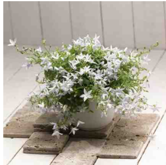
Campanula "White Star".

wortelen probleemloos. Een aantal heb ik met zijn vieren in hangpotten geplant en zowel in de kas als buiten opgehangen. In het voorjaar, wanneer de zon wat meer warmte geeft groeien ze snel uit en bedekken al gauw de wortelkluit. Door de warmte in de kas bloeien de planten