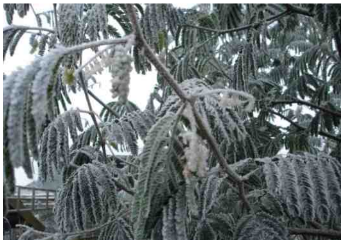
Een inschattingfout. Albizia Lophanta bevriest snel.

En als ik dan een appartement zou hebben met een balkon van drie bij drie meter zou ik toch nog wat kunnen tuinieren, zoals wat kuipplanten houden en verzorgen. Ik zou geen uren meer nodig hebben om al die fuchsia's en kuipplanten in de zomer water te geven. Geen zorgen over onkruid in de border en gazon, geen grasmaaien en